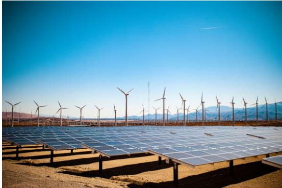
Bachmann liefert Komponenten für die Erzeugung, Verteilung und Speicherung von Energie